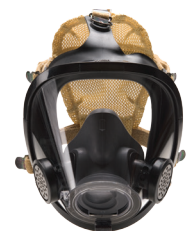
SureSeal System for AV-3000